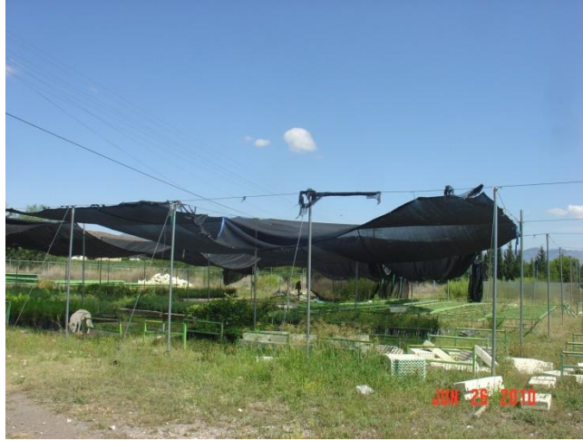
Señalizaciones en el área del vivero e invernadero del Departamento Forestal.