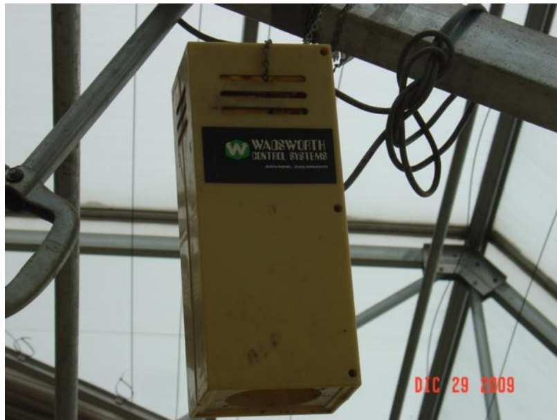
Sensor de luz y temperatura

Sensores y controladores de la temperatura en ambas naves del invernadero. Se pidió cotización a WADSWORTH CONTROL SYSTEMS en Arvada, Colorado USA vía internet.